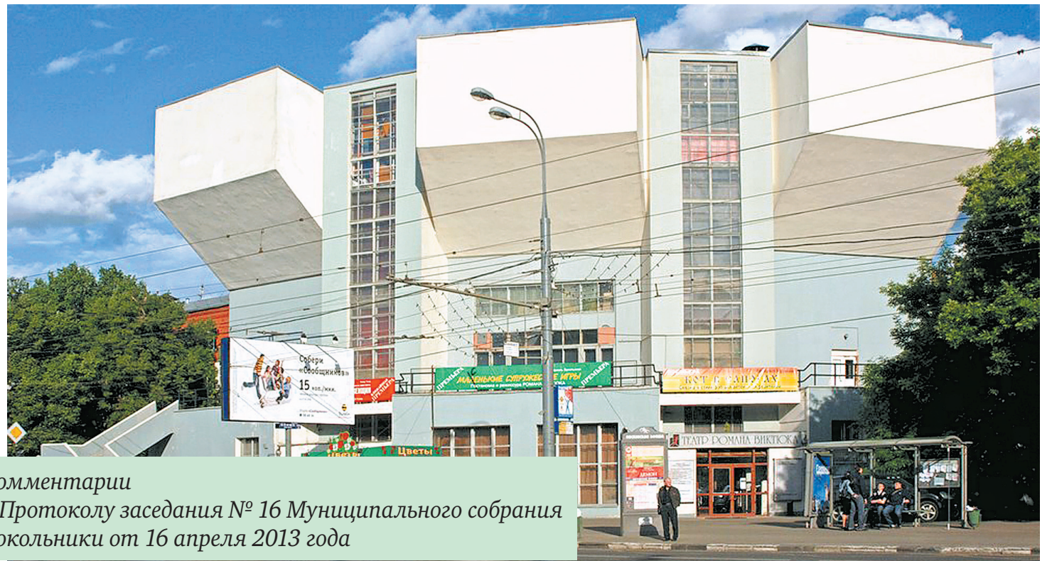
Комментарии к Протоколу заседания № 16 Муниципального собрания Сокольники от 16 апреля 2013 года

Итак, наше богатое муниципальное образование решением Муниципального собрания дало префектуре аж 82 миллиона рублей! Причем, на то, что префектура должна делать за бюджетные средства. Откуда у Сокольников такие деньги, судя по всему, лишние? Очень интересный вопрос. Дело в том, что это остаток от тех 154 миллионов рублей, за которые был продан торговый центр «Раздолье». Оставим до поры в стороне вопрос, почему «Раздолье» продали всего за 154 миллиона, а не за 700 миллионов, сколько торговый центр стоил по оценке некоторых экспертов по недвижимости. В любом случае, полученные за «Раздолье» деньги принадлежали всем жителям района. Их можно было пустить на какие-то благие дела, например, на реставрацию Клуба им. Русакова, который затем вернуть детям, как это было до 1997 года. (Виктук, получивший